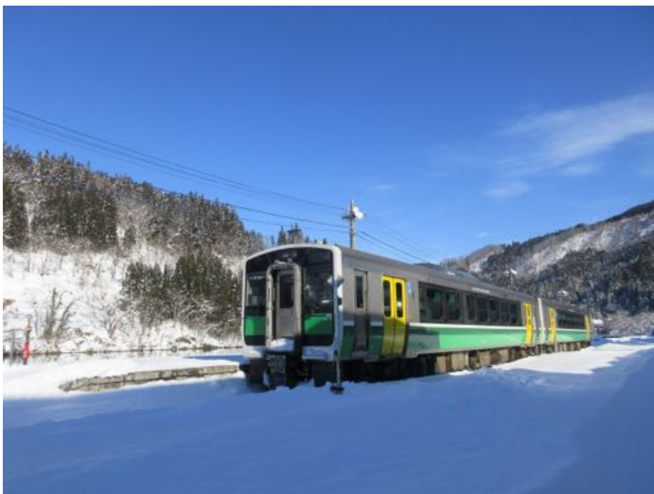
【JR 只見線（会津川口駅⇄只見駅不通）—今年秋頃全線開通予定（会津川口駅）】